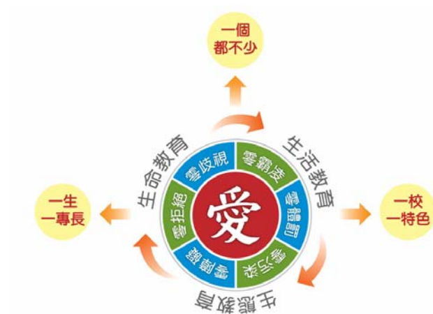
圖 2 教育 111 的架構

從圖 2 顯示，「教育 111」是以「愛」為主軸，在「三生」教育內容（生活、生命和生態）下，形塑六零學習環境—零體罰、零霸凌、零拒絕、零歧視、零障礙、零污染，使學生能安心學習，發展其專長能力。